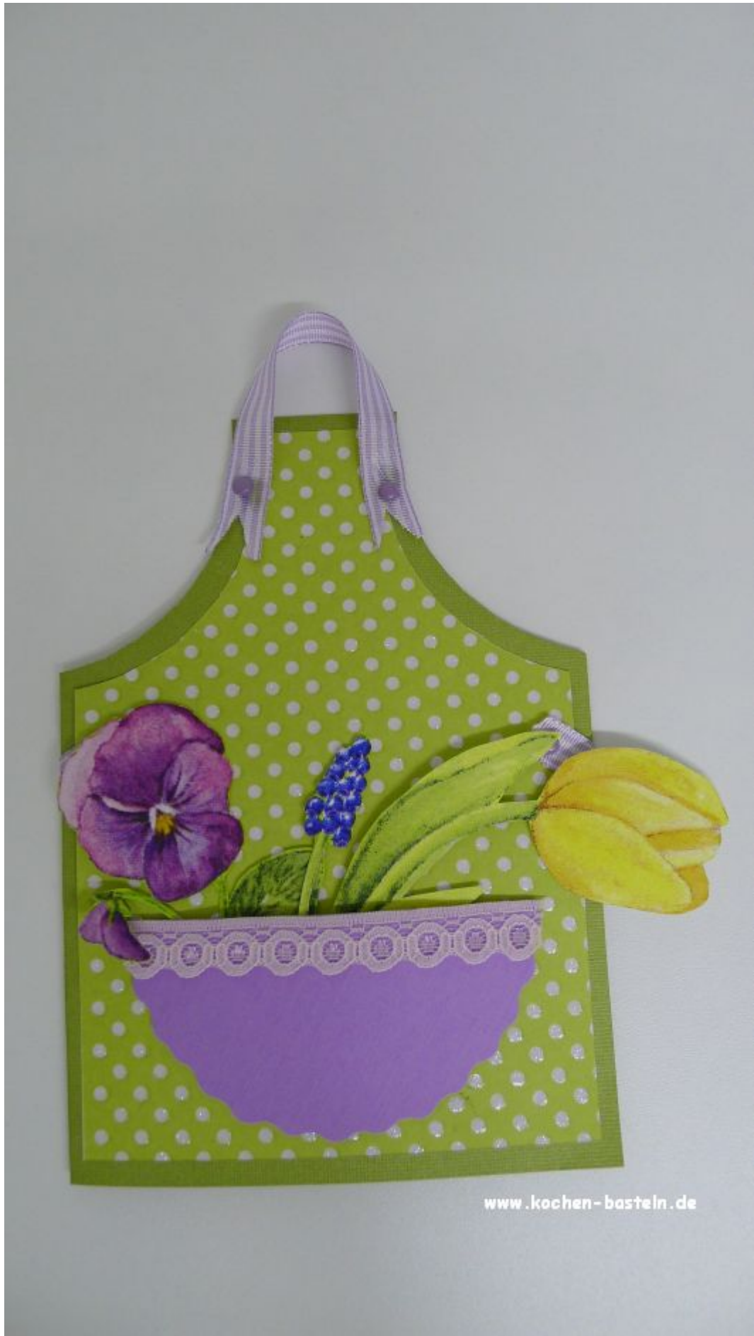
einen Gutschein für Blumen oder Gartenpflanzen, im Innenteil könnten dann vielleicht auch Tütchen