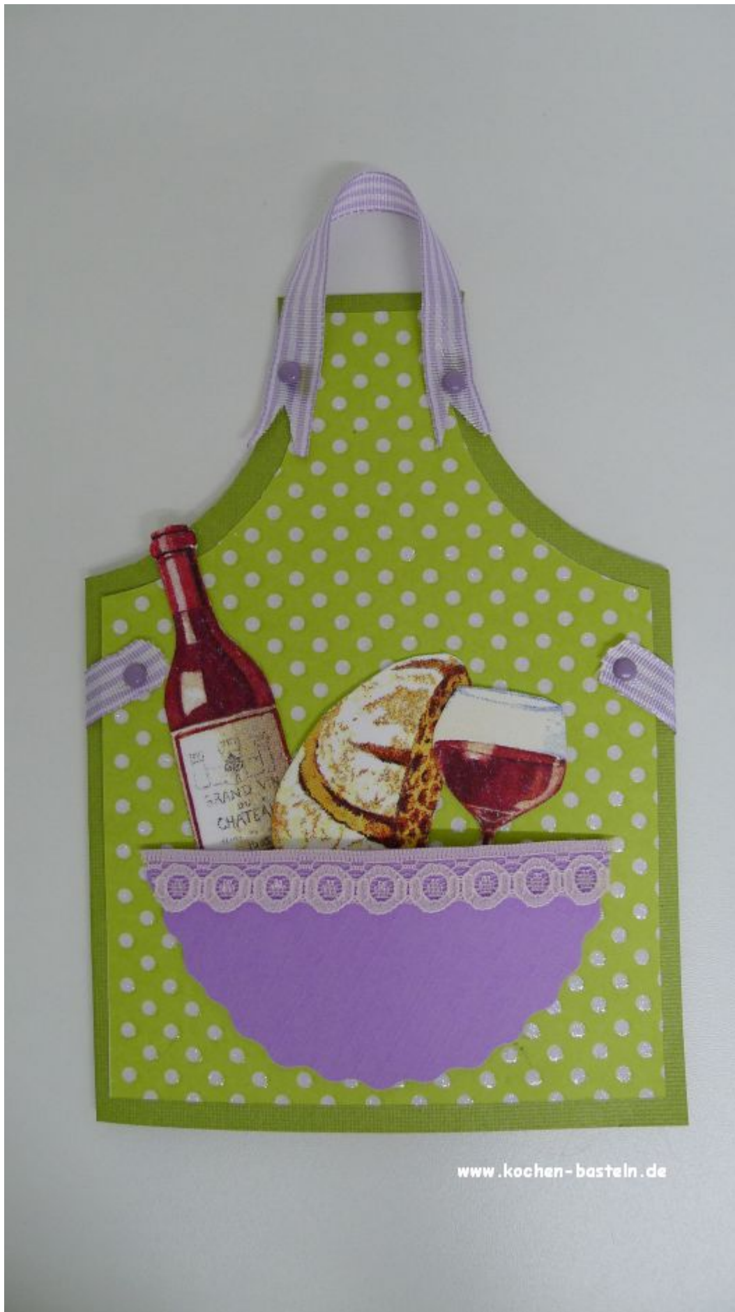
ein Gutschein zum Beisammensein mit einem guten Tropfen oder einem Kochkurs eine Einladung /